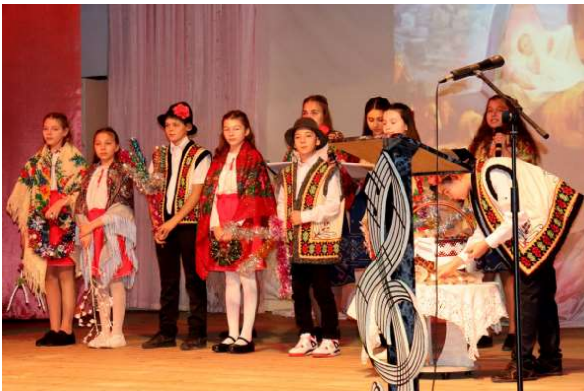
Республиканский фестиваль гражданско-патриотической направленности «Мы этой памяти верны!»