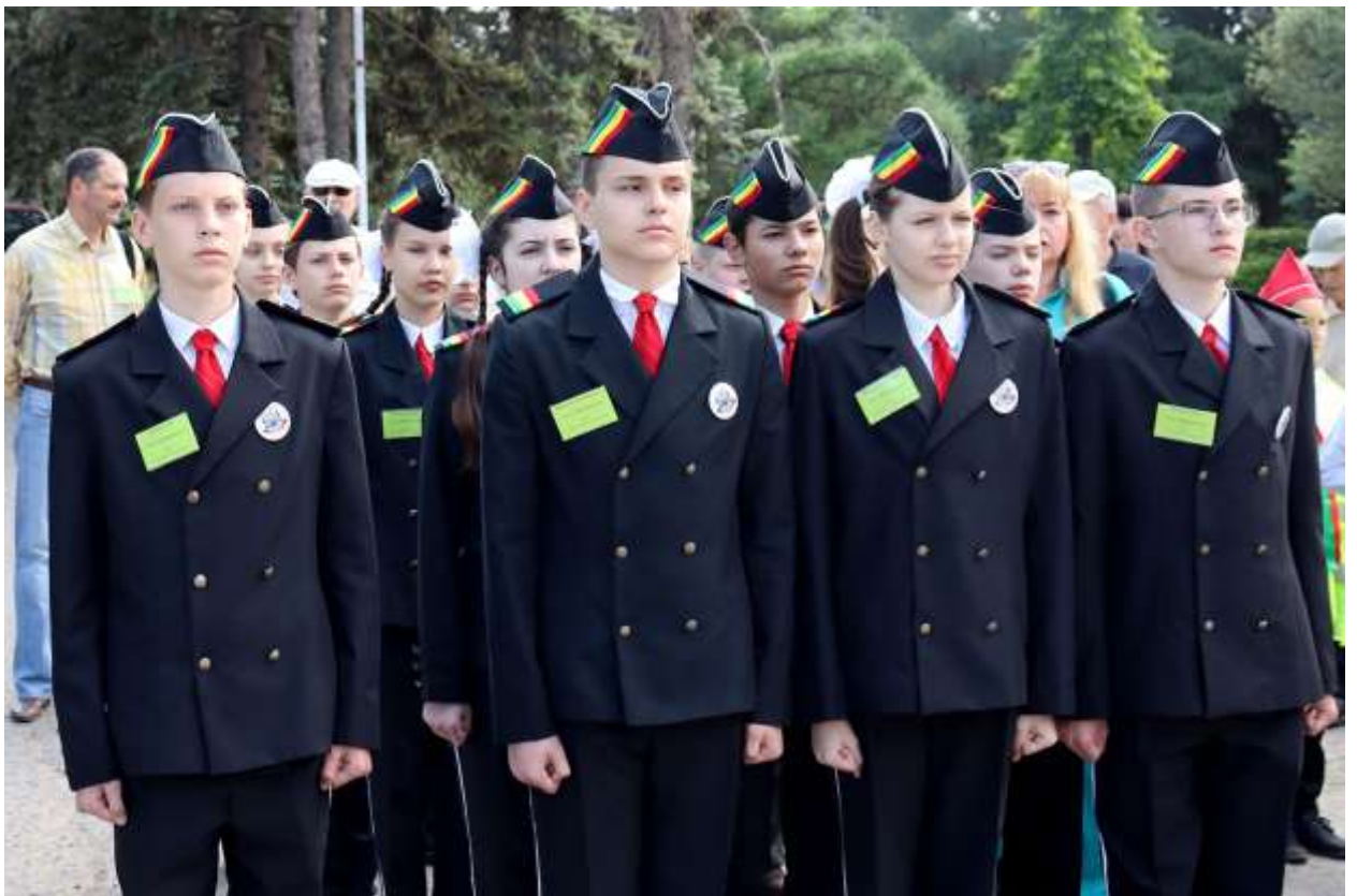
Волонтерская экологическая акция