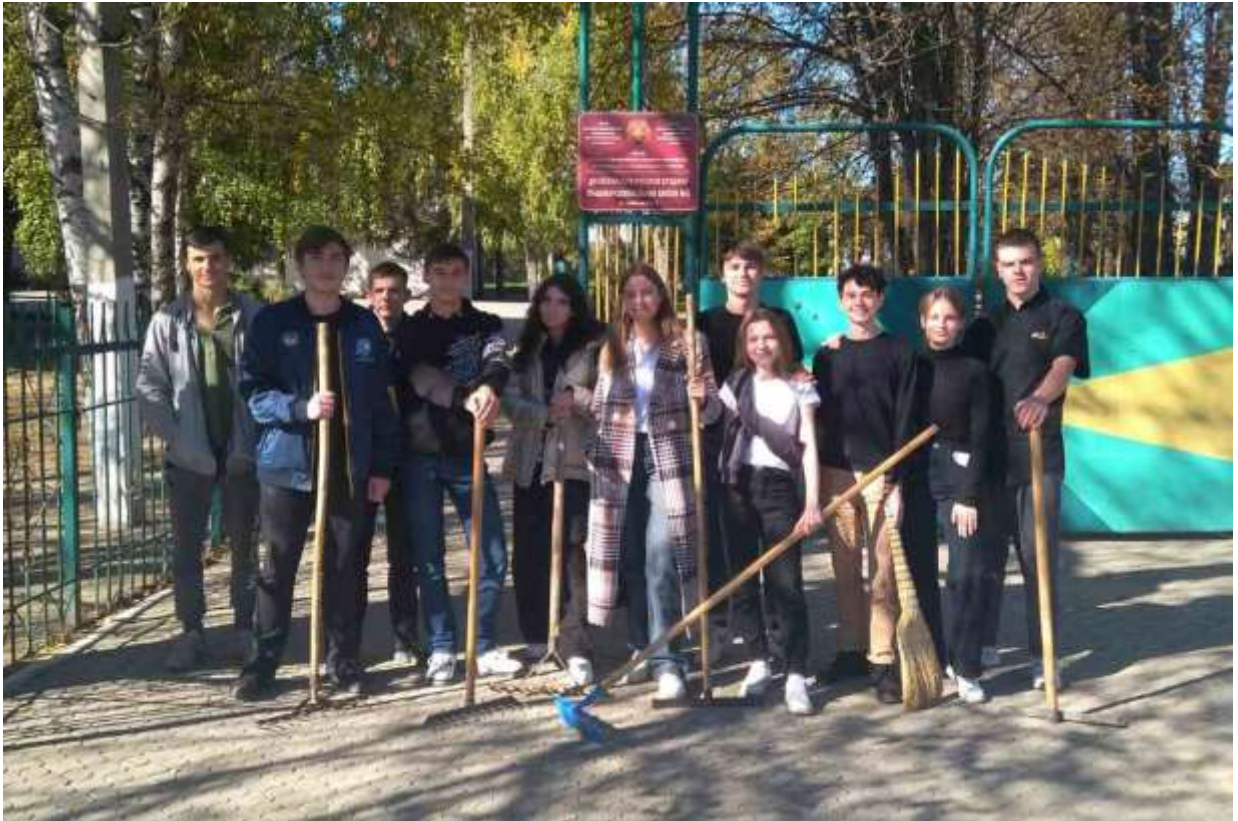
Международная патриотическая акция «Сад памяти»