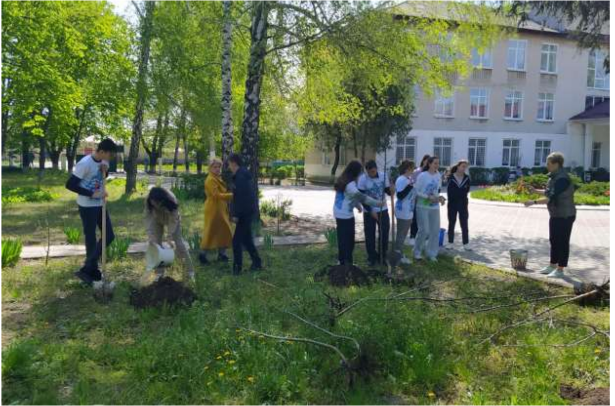
Патриотические мероприятия, посвященные 79-й годовщине со дня освобождения города и района от немецко-румынских оккупантов