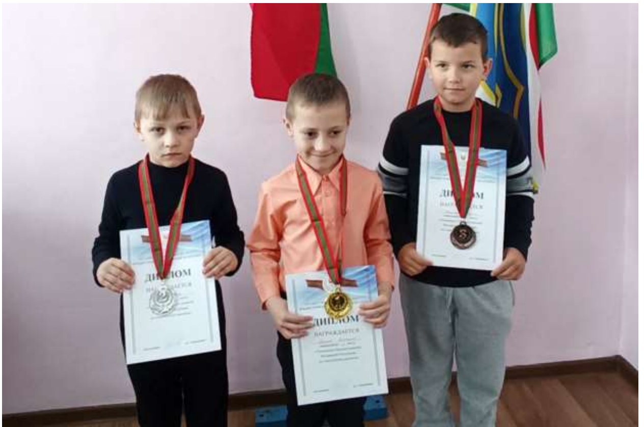
Муниципальный тур конкурса «Юный инспектор движения Приднестровья – 2023»