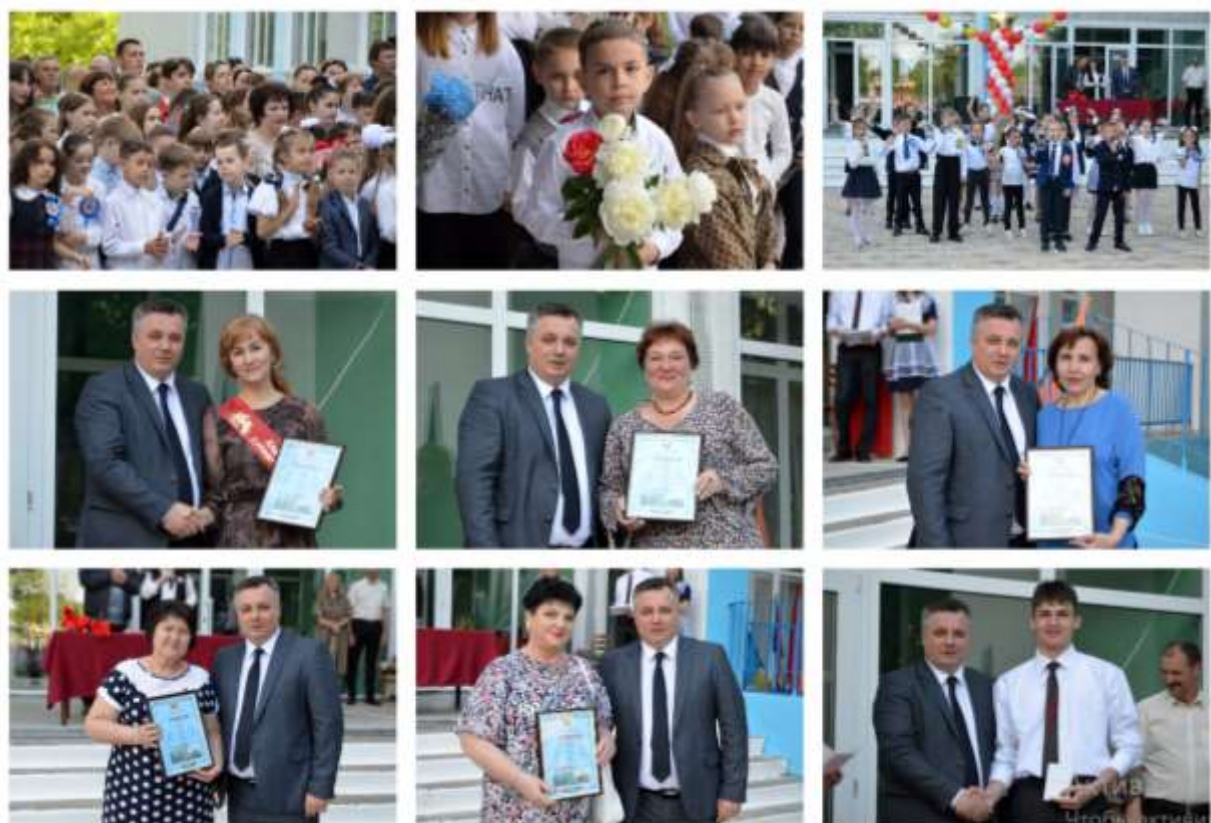
В Дубоссарах чествовали медалистов. Церемония чествования медалистов прошла на площади Победы. В этом году школу окончили 120 ребят. 26 из них – медалисты. 10 выпускников получили золотые медали, 16 – серебряные.