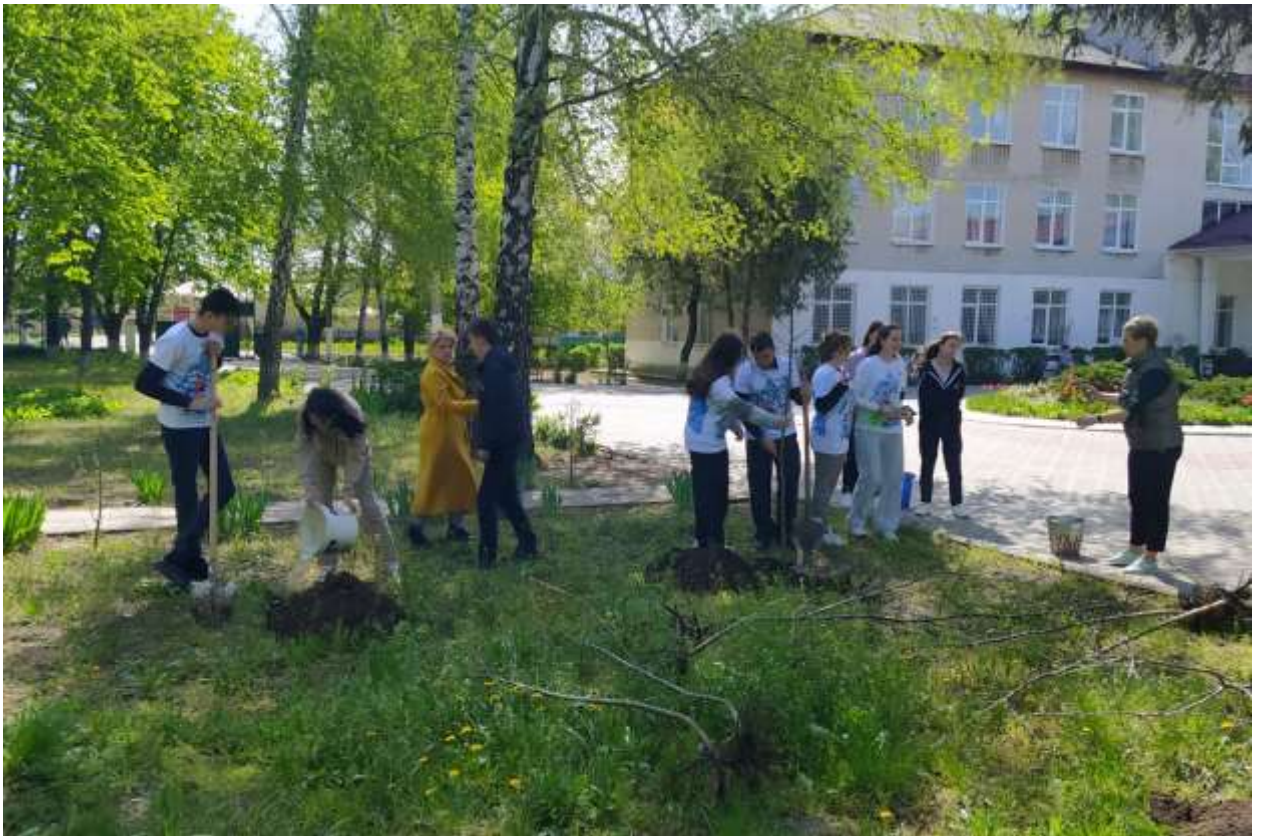
Патриотические мероприятия, посвященные 79-й годовщине со дня освобождения города и района от немецко-румынских оккупантов