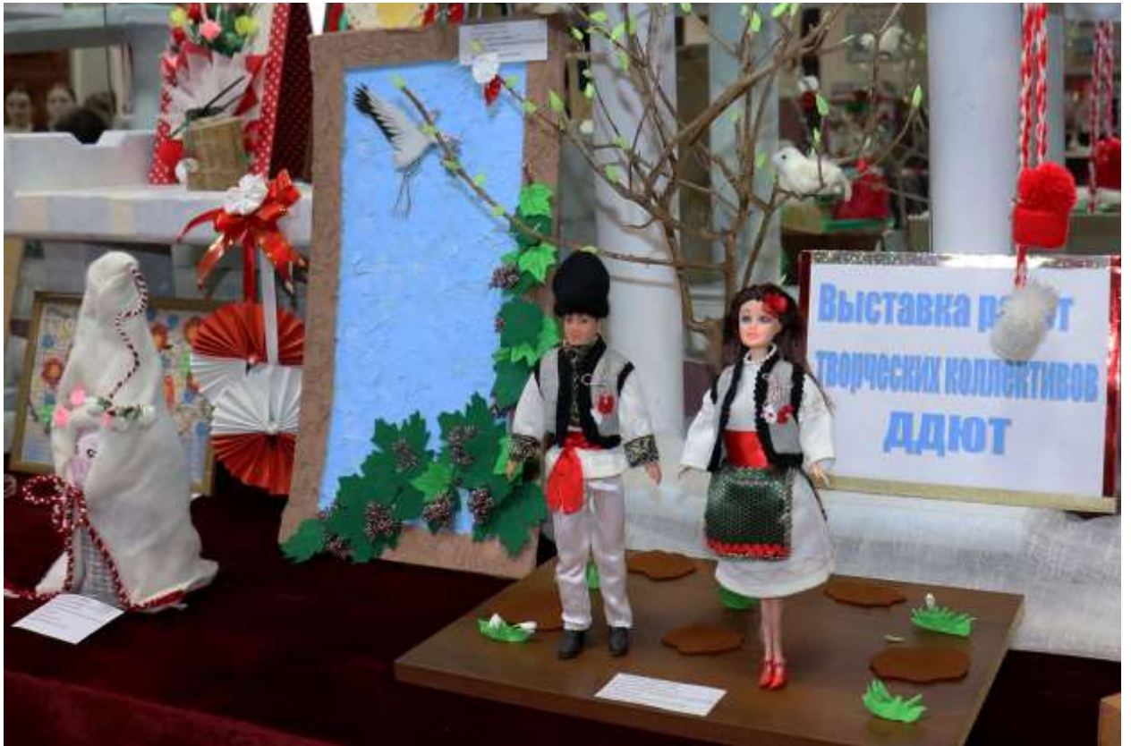
Республиканский исторический конкурс «Моя страна - мое Приднестровье»