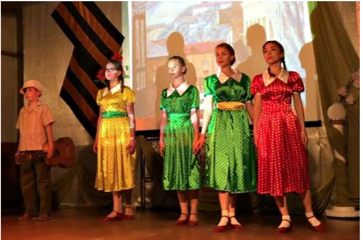
Мероприятия ко Дню православной молодежи