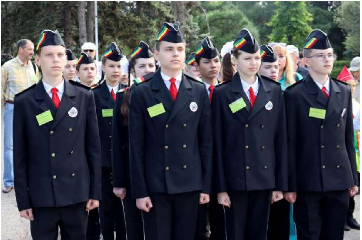
Волонтерская экологическая акция