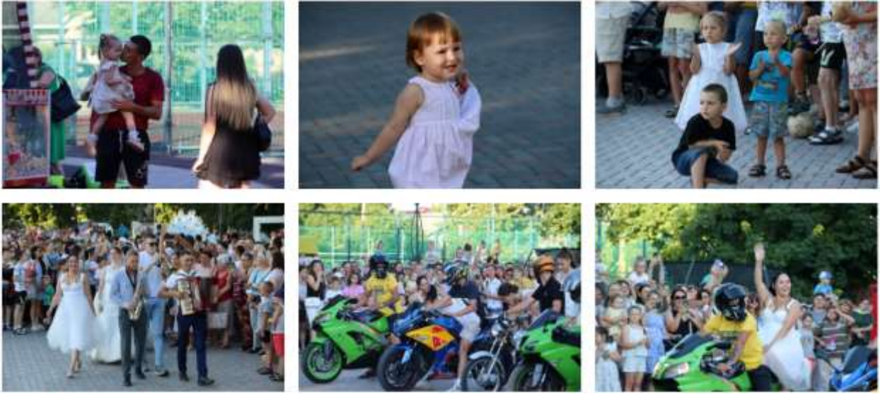
Фестиваль памяти Высоцкого в Дубоссарах