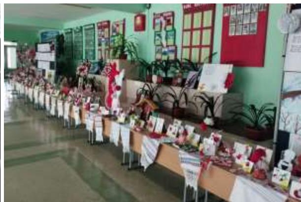
Республиканский исторический конкурс «Моя страна - мое Приднестровье»